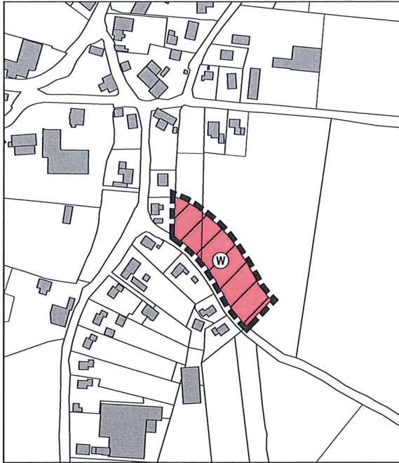
Darstellung der 4. Änderung des Flächennutzungsplanes